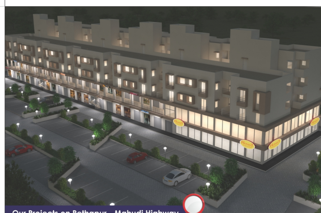
Our Projects on Pethapur - Mahudi Highway

ઇશ્વરની ઝંખના કરતા હજારો-લાખો શ્રદ્ધાળુઓનું પવિત્ર તીર્થસ્થાન એટલે મહુડી. પ્રભુના દર્શન માટે અને પવિત્ર સુખડીના પ્રસાદનો લાભ લેવા ભકતો સેંકડો કિલોમીટરની યાત્રા કરીને આવે છે. મંદિરનાં ઇંટનાદ અને શંખના સૂરનો સંગમ મહુડી અને તેની આસ-પાસનાં વિસ્તારનાં વાતાવરણને પાવન અને ભક્તિમય બનાવી દે છે. આજનાં વિકાસશીલ અને આધુનિક વિશ્વમાં આવા વાતાવરણમાં નિવાસ કે વ્યવસાયનું સ્વપ્ન, સ્વપ્ન જ બનીને રહી જાય છે, પરંતુ આ સુંદર અદ્ભુત સ્વપ્ન સાકાર થઇ જ શકે છે, શ્રીમ ગ્રુપની ભક્તિમય 'અનંતધારા' થકી જ.